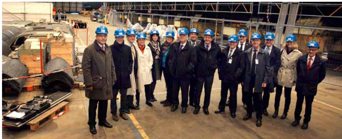
Saabs styrelse vid besök på Saab Kockums i Karlskrona under 2014.

Styrelsen har utsett tre ledamöter till ett revisionsutskott i enlighet med principer i aktiebolagslagen och Kodens. Revisionsutskottets arbete är i huvudsak av beredande karaktär, det vill säga att förbereda ärenden för slutliga beslut av styrelsen. Revisionsutskottet har viss begränsad beslutanderätt. Utskottet har till exempel fastställt riktlinjer för vilka andra tjänster än revision som bolaget får upphandla av bolagets revisor.