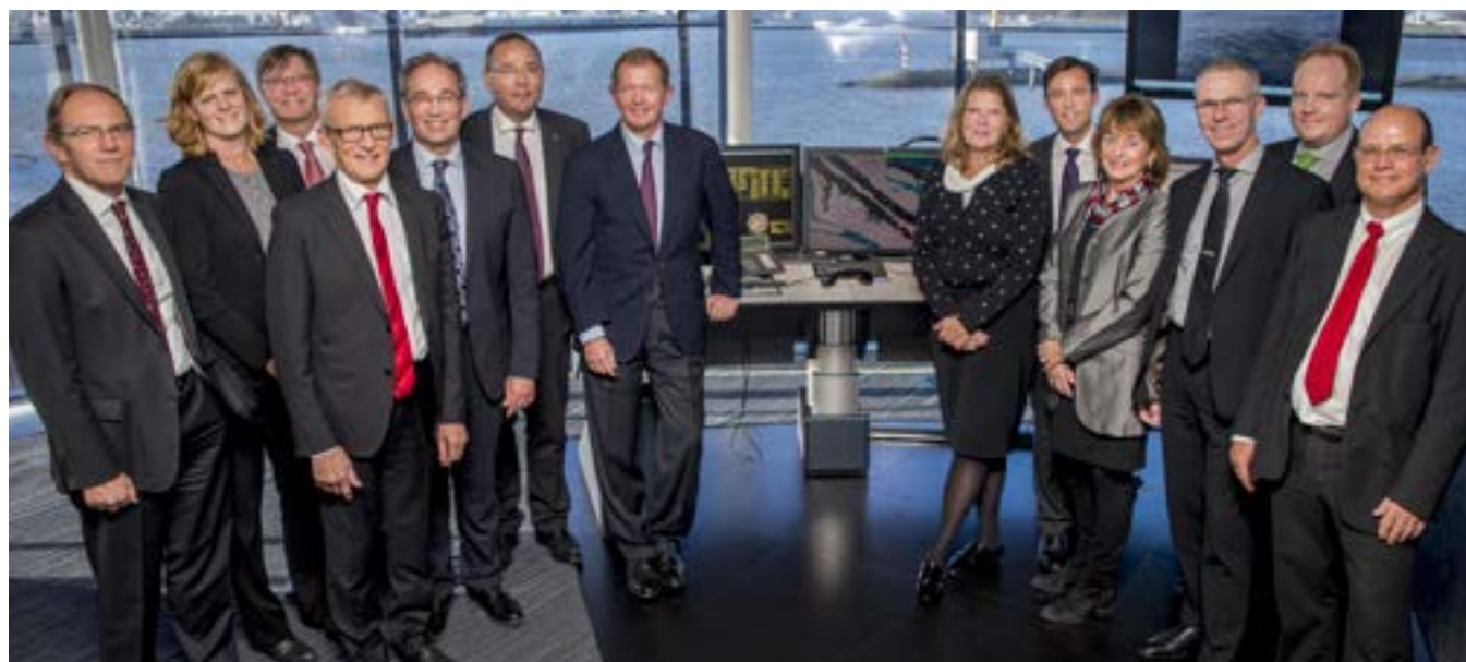
Saabs styrelse vid besök på trafikledningscentralen vid Rotterdams hamn.

Revisionsutskottets uppgifter framgår av styrelsens arbetsordning. Revisionsutskottet ska bland annat övervaka bolagets finansiella rapportering, övervaka effektiviteten i bolagets interna kontroll, internrevision och riskhantering med avseende på den finansiella rapporteringen, hålla sig informerat om revisionen av års- och koncernredovisningen, granska och övervaka revisorernas opartiskhet och självständighet samt biträda valberedningen med förslag till stämmobeslut om revisorsval. Revisionsutskottet ska även årligen övervaka och utvärdera effektiviteten och lämpligheten av bolagets affärsetiska program, inklusive uppförandekod, samt hålla sig informerat om väsentliga avvikelser